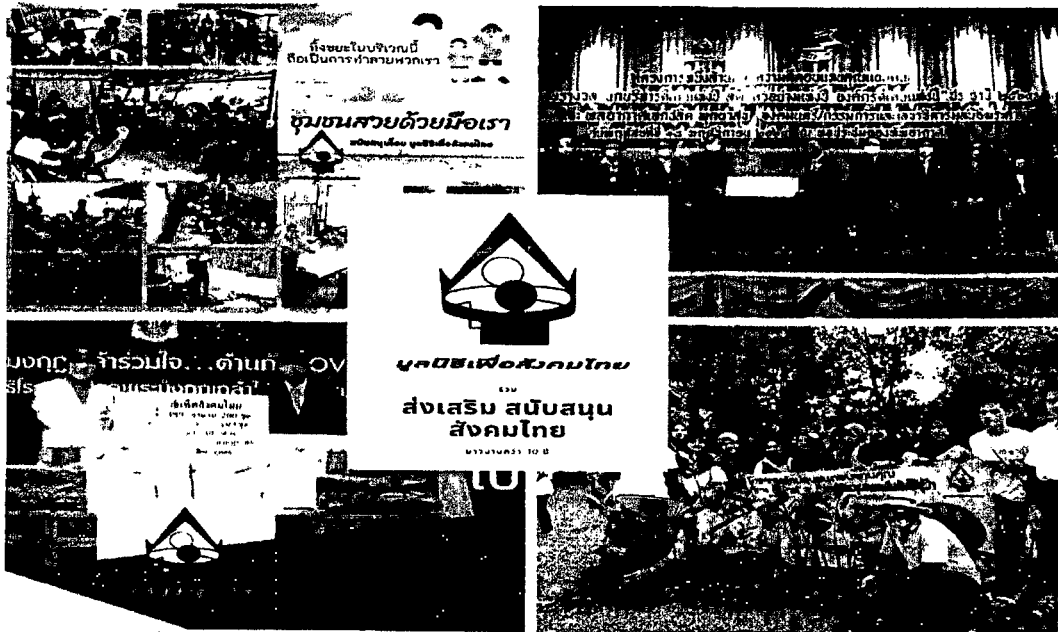
กิจกรรมเพื่อสังคมและประเทศชาติ(บางส่วน) โดยมูลนิธิเพื่อสังคมไทยและสมาชิกเครือข่ายรางวัลไทย